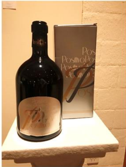
Positivo Leukersonne Körperreich und gehaltvoll mit einem fruchtig würzigen Bouquet